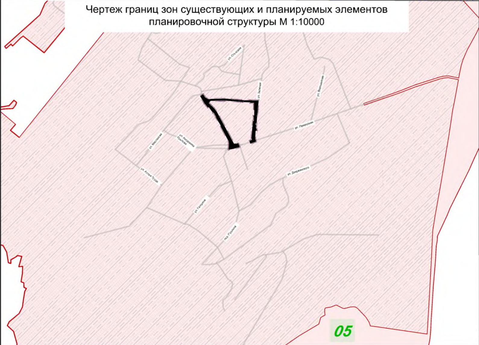
Чертеж границ зон существующих и планируемых элементов планировочной структуры М 1:10000

--- Граница разработки проекта межевания